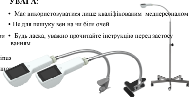
Table Clamp/Flexible Clamp/Roller Stand